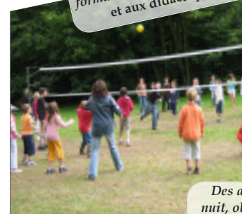
Des activités variées : feu de camp, jeu de nuit, observation du ciel, animent les soirées dans un cadre en pleine nature.