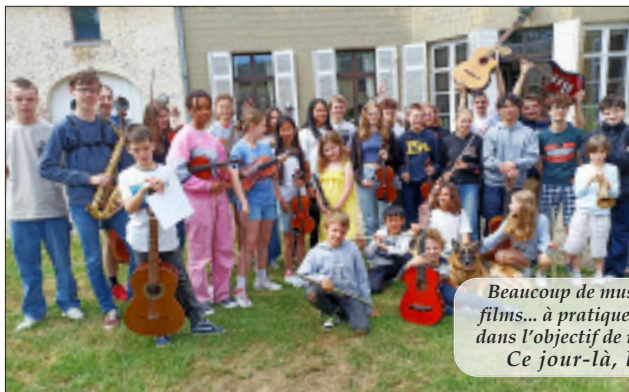
Beaucoup de musique classique, moderne, de films... à pratiquer en petit ou en grand groupe dans l'objectif de réussir le concert du samedi... Ce jour-là, la vedette... c'est toi!

Les stagiaires plus aguerris découvrent, eux, dans le jeu orchestral, de nouvelles expériences comme autant de sources de progrès durables. En recourant aux procédés didactiques les plus innovants - la didactique de projet et l'observation des biorythmes naturels par exemple- la méthode Ostinato place Ostin au rang de tête des institutions à projets pédagogiques.