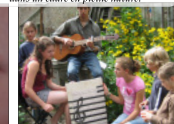
Une didactique ludique adaptée à l'âge et à l'avancement de chacun, mise en œuvre par des moniteurs attentifs.