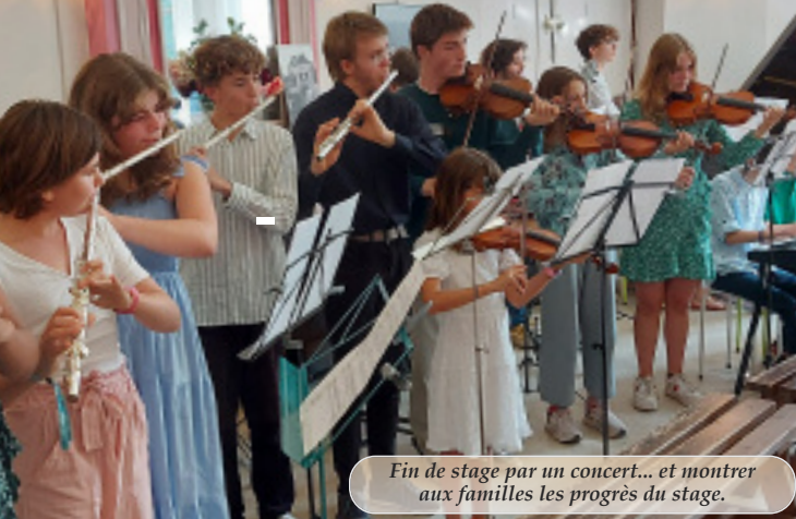
Fin de stage par un concert... et montrer aux familles les progrès du stage.