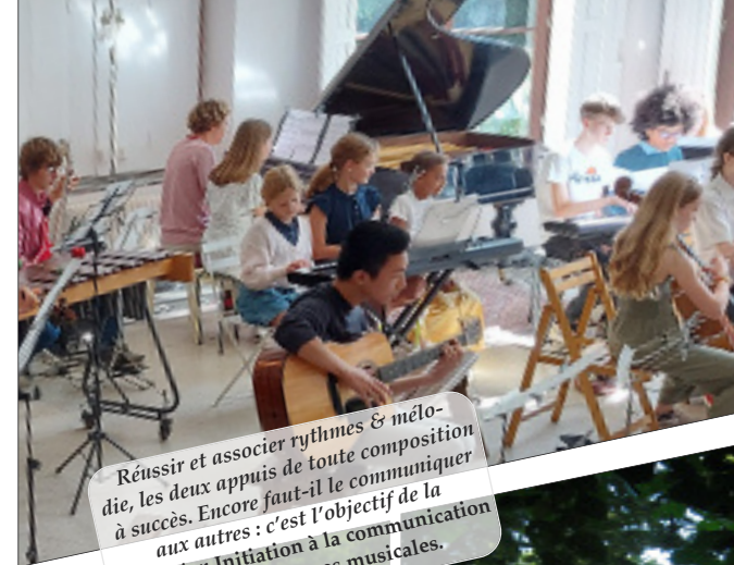
Réussir et associer rythmes & mélodie, les deux appuis de toute composition à succès. Encore faut-il le communiquer aux autres : c'est l'objectif de la formation Initiation à la communication et aux didactiques musicales.